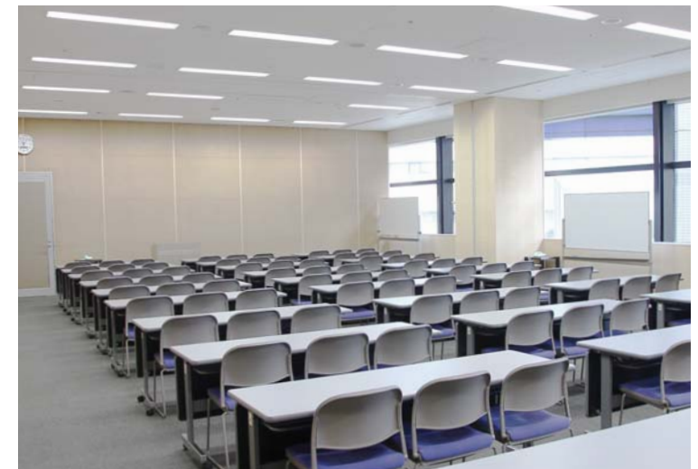
会議室 2 + 3 + 4