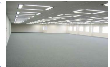
基準階オフィスフロア