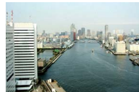
基準階からの眺望