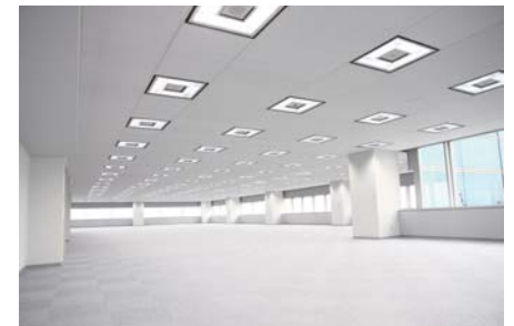
基準階オフィスフロア