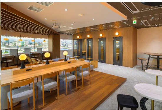
ラウンジには個室ブース 4 室設置