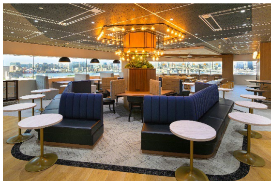
契約者専用ラウンジ