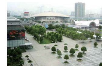
A棟東区画から北側を望む