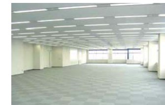
基準階オフィスフロア（B棟西区画）